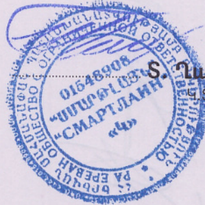
Ս. Վարիբյան Կ.Տ.