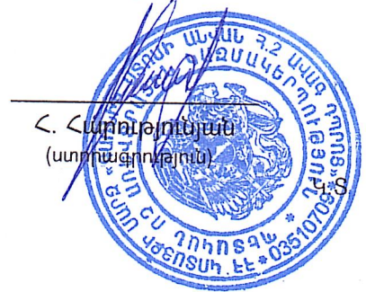
Հ. Հարությունյան (ստորագրություն)

«Գառնիի Ատոմի անվան հ.2 ավագ դպրոց» ՊՈԱԿ գ. Գառնի, Զ. Ալեքյանի փող ՀՀ ՖՆ գործառնական վարչություն Հ/Հ 900018002635 ՀՎՀՀ 03510709 Տնօրեն՝